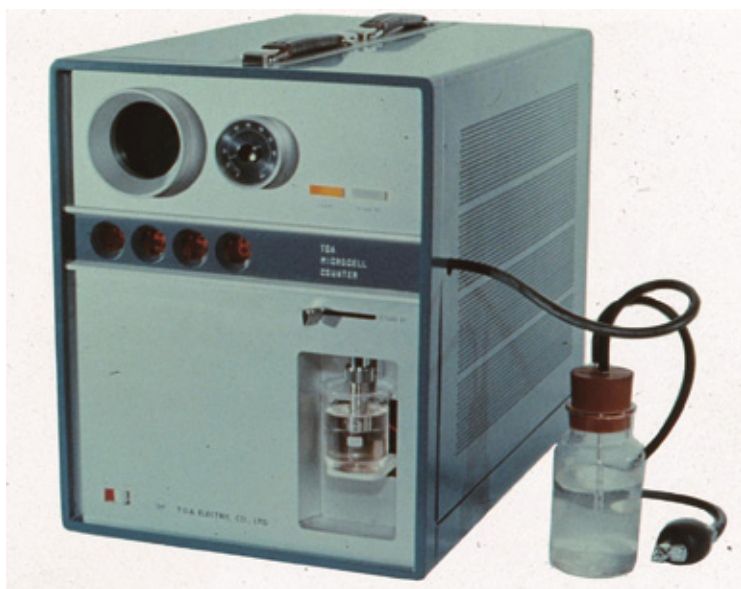
国産初の血球分析装置「CC-1001」